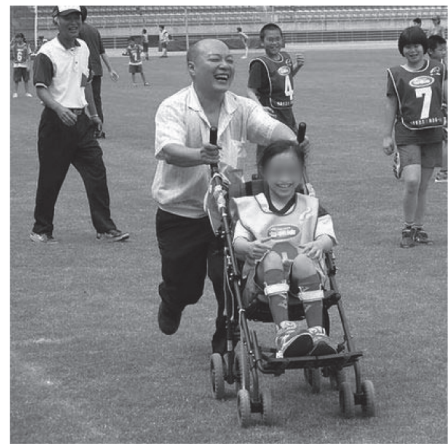
輪椅者跑壘時可加派 1 名助推員協助跑壘。