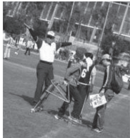
使用行動輔具之擊球員,若擊出超過 9 公尺即判 1 壘安打,可慢跑上壘得分。